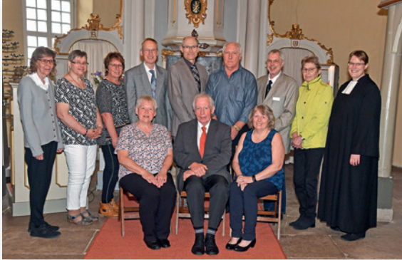
Goldene Jubelkonfirmation (50 Jahre)