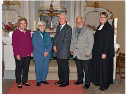
Eiserne Jubelkonfirmation (65 Jahre)