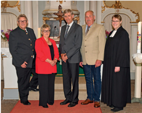
Diamantene Jubelkonfirmation (60 Jahre)