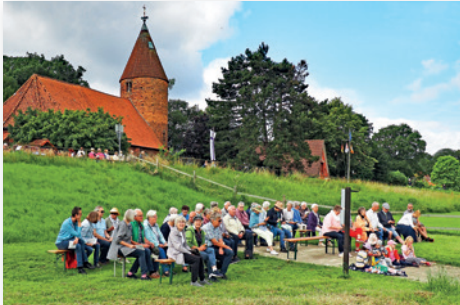
Loge und Parkett auf der Westener Seite.