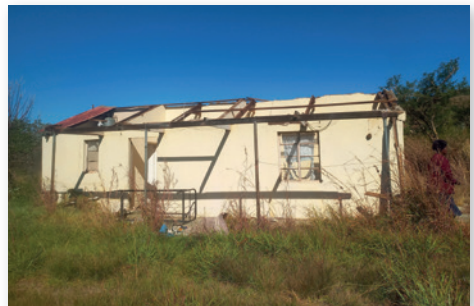
Nebengebäude des Altenheims in Rorke's Drift