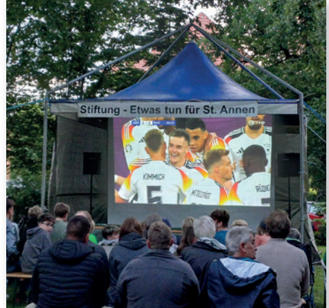
Treffplatz an der Kirche zum Fußballgucken.

Schade, dass die EM leider bereits nach 5 Spielen für die deutsche Mannschaft (etwas unglücklich) zu Ende war – wir hätten auch gerne noch 2 weitere Abende mit allen verbracht. Unser Einsatz hat sich in mehrfacher Hinsicht