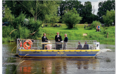
Gute Laune auf der Fähre.