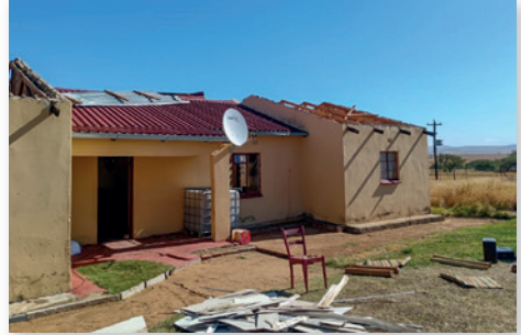
Haus der Familie des ehemaligen Pastors Mbatha