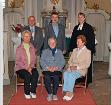
Gnadene Jubelkonfirmation (70 Jahre)