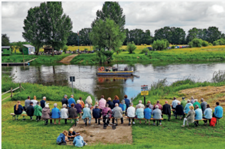
Singen mit Bläserunterstützung von beiden Seiten.