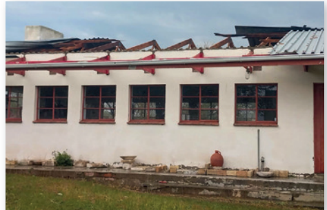
Ein abgedecktes Gebäude des Arts and Craft Centre