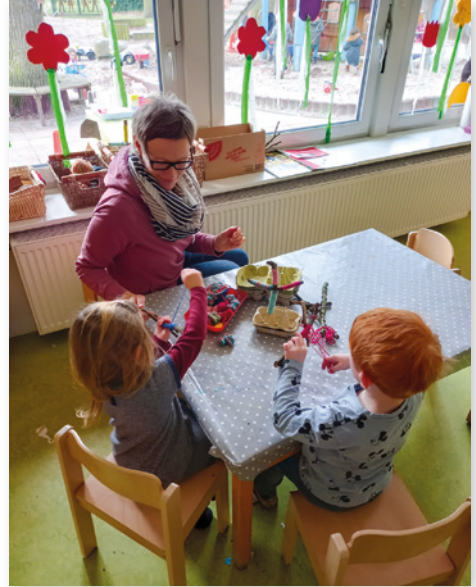
Osterbasteln im Kindergarten.

In der Kita verbringen heute Kinder aus allen Teilen der Welt ihr Leben miteinander, um zu spielen, zu lernen, um Freunde zu finden, kurz: um einen guten Start ins Leben zu haben. Dass dazu auch das Feiern fröhlicher Feste im interkulturellen Kontext gehören, versteht sich eigentlich von selbst. Hierzu hat unsere Kollegin mit den Kindern in den Gruppen Kreuze aus Stöckern gebastelt und diese mit bunter Wolle umwickelt und in einer Eierpappe befestigt, die noch mit Moos ausgekleidet wird, sodass jedes Kind seinen eigenen Garten hat. Ostereier suchen und das Osterfest nach christlicher Tradition feiern... Geht das? Der Hase als Symbol des Frühlings und