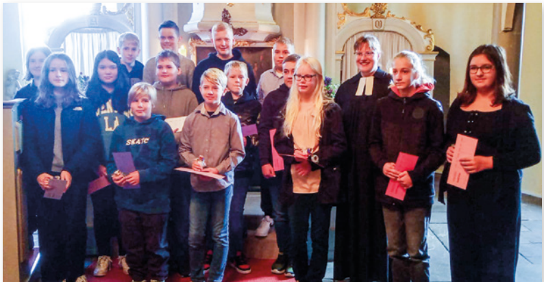
So fing damals alles an