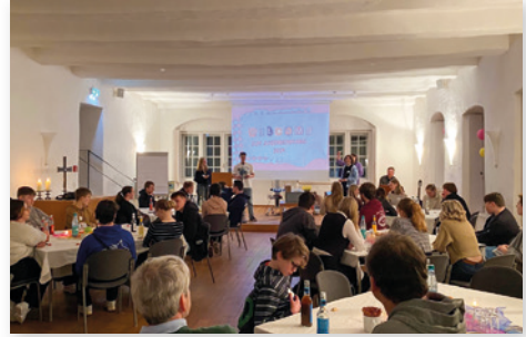
Jahresempfang mit allen Ehrenamtlichen.

K napp 50 Jugendliche sind der Einladung des Kirchenkreisjugendkonvents sowie der Diakone im Kirchenkreis Verden gefolgt. Sie waren Gäste des Jugendempfangs, der wie jedes Jahr Anfang Februar stattfand. Der Empfang ist ein Dankeschön an alle ehrenamtlich mitarbeitenden Jugendlichen, ohne deren Unterstützung viele Angebote nicht möglich wären! Eine Bilder Show aller kirchenkreisweiten Aktionen, die 2023 stattfinden konnten, zeigte dieses sehr deutlich. Auch Superintendent Steinhausen, der ebenfalls an dem Abend anwesend war, bekräftigte dieses in seiner Rede noch einmal. Ebenfalls anwesend war die kürzlich neu in ihr Amt gewählte Landesjugendpastorin Mirjam Heuermann. Ihr bot sich an dem Abend eine gute Gelegenheit, die evangelische Jugend im Kirchenkreis Verden kennen zu lernen. Nach einem warmen, chinesisches Essen gab es im weiteren Verlauf des