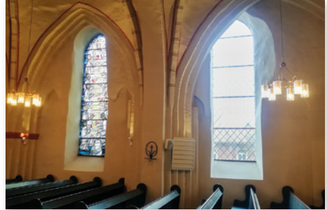
Dieses leere Fenster wartet auf eine künstlerische Gestaltung.