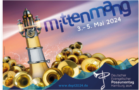
Deutscher Posaunentag in Hamburg.