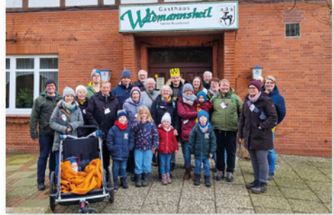
Alle Teilnehmenden der Kohltour

Am 24. Februar machten sich bei bestem Kohl-Wetter Mitglieder des Posaunenchors Dörverden mit Familien auf den Weg zur diesjährigen Kohltour. Durch den Wald folgte das musikalische Kohlvolk seiner Königin Elisabeth bis zum Gasthaus Waidmannsheil in Diensthop, in dem eine köstliche Stärkung genossen werden konnte, bevor das Volk sich unter seinem neuen König Thilo auf den Heimweg machte. Unterwegs gab es fröhliche Spiele, viel Geselligkeit und Zeit für Gespräche und Austausch. Wieder einmal eine