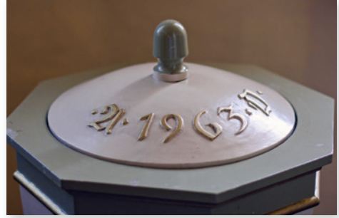
Taufbecken in der St. Annen Kirche

tisch auch seiner Kirchengemeinde an. Ab dem 14. Lebensjahr darf er oder sie den Kirchenvorstand und das leitende Gremium des Kirchenkreises mitwählen. Ab dem 16. Lebensjahr darf jedes Kirchenmitglied sich selbst in den Kirchenvorstand wählen lassen. Gemeinschaft ist nach wie vor ein zentraler Wert für das Christentum. Nur gemeinsam im Austausch und in der Bestärkung lassen sich Phasen des Zweifels überstehen. Darum feiern wir Taufe im sonntäglichen Gemeindegottesdienst. Jedes Gemeindeglied soll die Möglichkeit haben, ein neues Mitglied kennenzulernen und bewusst in diese Gemeinschaft aufzunehmen. Der Reformator Martin Luther prägte das drastische Wort, in der Taufe werde täglich unser alter Adam ersäuft. Luther meint damit, dass ein Mensch zwar nur einmal in seinem Leben getauft wird, dass sich aber das, worauf