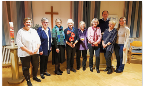
oben: Graffiti „Blick auf Jerusalem“ auf der Mauer in Bethlehem unten: Die intensive Vorbereitungszeit hat sich gelohnt!