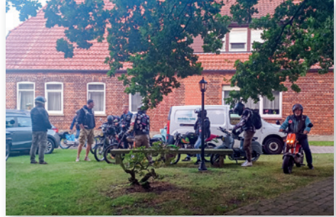
Eintreffen der „Mofa-Gang“.

Nachdem wir im letzten Gemeindebrief vom „Rudelgucken“ anlässlich der Fußball-EM berichtet hatten, ging es im August ganz ähnlich weiter: wir waren (wieder) beim Open-Air-Kino auf dem Kirchplatz dabei und haben die Zuschauenden mit Getränken versorgt! Im Vorfeld galt es wiederum die Getränkeauswahl zu treffen und die zu erwartenden Mengen abzuschätzen und einzukaufen, den Kühlschrank zu organisieren und alles vorzubereiten – mittlerweile fast Routine. Der Sommerabend hätte zwar noch etwas wärmer sein dürfen, aber entsprechend vorbereitet und ausgerüstet, ließ es sich auch so ganz gut aushalten. Das Vorprogramm startete ab 20 Uhr und kurz bevor der Film los ging, fand sich die „Mofa-Gang“ aus Hülsen ein – das war eine schöne Überraschung und passte hervorragend zum Film „25 km/h“ – ein Roadmovie zweier