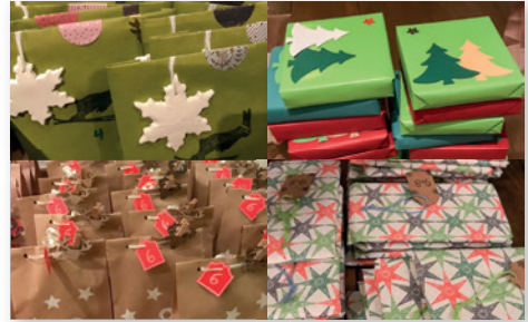
24 kleine Freuden in der Adventszeit

Wir suchen 25 Teilnehmende aus beiden Gemeinden, die gern mitmachen und sich über einen eigenen und individuellen Adventskalender freuen möchten. Dazu werden nach der Anmeldung die Nummern 1 - 24 vergeben und jeder packt 24 genau gleiche Päckchen. Hinein darf eine kreative Kleinigkeit: Selbstgebackenes, Gebasteltes oder Gekauftes. Bisher hatten wir tolle Ideen dabei: selbstgekochte Marmelade, Lippenbalsam, Pralinen, Dekoratives, Windlichter, Lesezeichen, Handcreme, Tee (letzteres kam sehr oft vor, deshalb an dieser Stelle eine Bitte, ob sich eine Al-