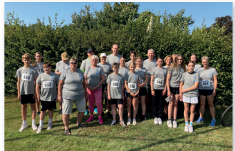
Das Team für Dörwerden läuft