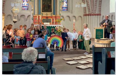
Ich schenk dir einen Regenbogen!