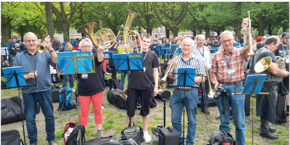
Mit Spaß dabei!