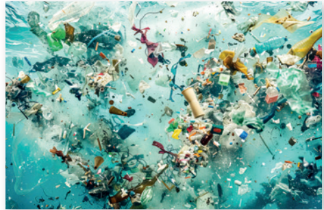
Plastikmüll sammelt sich im Meer.

Im christlichen Bewusstsein ist der Gedanke des Verzichtes im Grunde nichts Neues, sondern durch die biblische und kirchliche Tradition des Fastens eine ureigene gute christliche Tradition, die sich immer stärker in der spirituellen Praxis niederschlägt. Das steigende Interesse an spirituellen Einkehrtagen, in die auch das Fasten integriert ist, oder die Angebote von Kirchengemeinden für die Passionszeit „Sieben Wochen ohne“ sind Beispiele der gemeinsamen Einübung in eine Ethik der Genügsamkeit. Wir brauchen eine stärkere Akzeptanz einer Ethik der Genügsamkeit, ja sogar eine Bereitschaft zum „Weniger“, zum Verzicht. Darin äußert sich auch eine Verschiebung der Werte von rein materiellem Wohlstand zu einem anderen Wohlstand, wie z. B. Zeitwohlstand oder Reichtum an sozialen Beziehungen. In allen diesen Aktionen ist auch eine ideologische und praktische Abkehr vom Denken in den Kategorien des Wachstums zu sehen, das viele Jahre