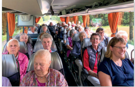
Eine Busfahrt, die ist lustig...

Am letzten Freitag im Juli haben sich insgesamt 46 Teilnehmer, darunter acht Männer, des Seniorenkreises der Kirche und der AWO auf große Fahrt begeben. Silvia Krüger und Corinna Schäfer begrüßten die Teilnehmer, während der Fahrt hielt die Pastorin eine kurze Andacht. In Dümmerlohausen angekommen, wurden wir vom Gästeführer der „Aalräucherei Hoffmann“ begrüßt. Er erzählte der Gruppe etwas über die Aufzucht der Aale in Gefangenschaft und den beschwerlichen Weg von den Laichgebieten in der Nähe von Florida in unsere heimischen Gewässer. Am Räucherofen wurde uns der frisch geräucherte Aal und andere Fischspezialitäten schmackhaft gemacht. Im Restaurant wurde dann Torte und Kaffee satt aufgetischt, alle haben es sich munden lassen. Danach hatten alle noch zwei Stunden zur freien Verfügung, diese wurde von vielen zu einem Spaziergang oder zum Verweilen auf den Bänken am Wasser genutzt, um das Treiben am Dümmer zu beobachten. Vor der Heimfahrt wurden noch ordentlich Aale und Räucherfisch oder Fischbrötchen für das Abendessen eingekauft. Wieder in Westen angekommen, waren alle der Meinung, das es ein schöner und gelungener Ausflug war.