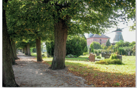
Friedliche Stimmung zwischen Linden und Mühle

Treffpunkt ist 14.30 Uhr an der Kapelle auf dem Friedhof.